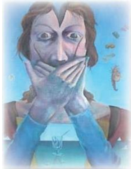
Posture des esprits

Lorsqu'un personnage meurt, le joueur se transforme en esprit et adopte la posture caractéristique propre à ce genre de créature avec les mains sur la bouche (cf. dessin). Le corps du personnage reste à terre (avec ses possessions) et commence sa décomposition. L'esprit du personnage peut encore errer durant une heure mais s'il ne trouve aucun cimetière en fonctionnement, il finit par disparaître.